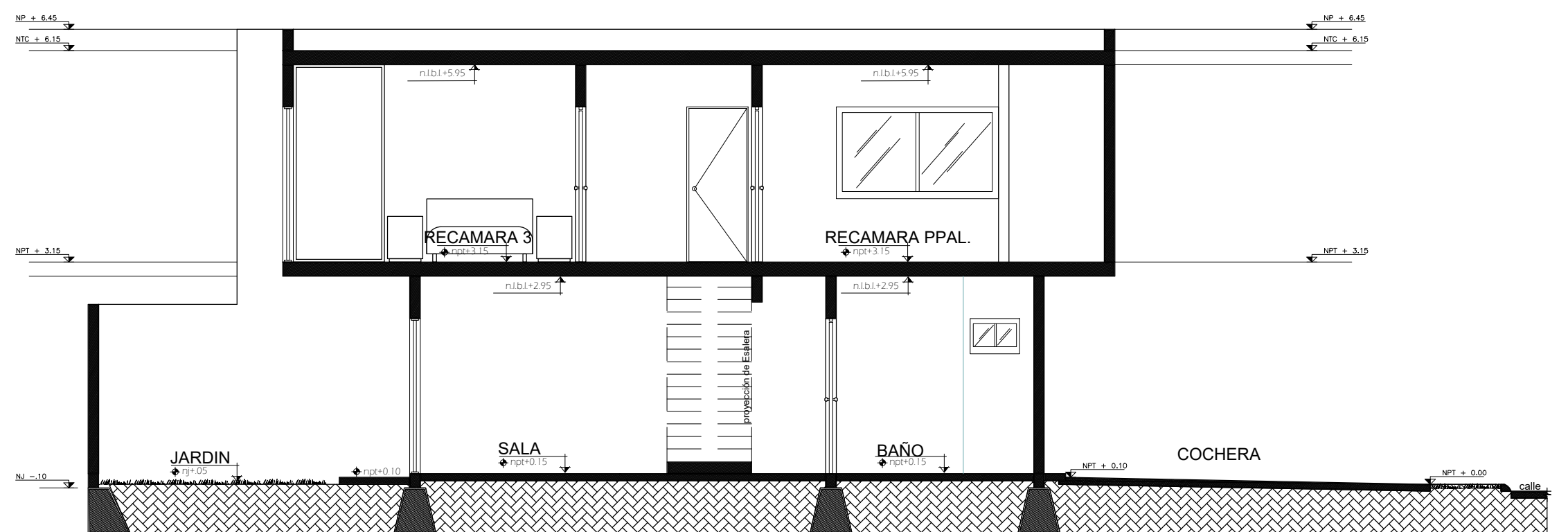
CORTE LONGITUDINAL 1 CT-A ACOT.: mts.