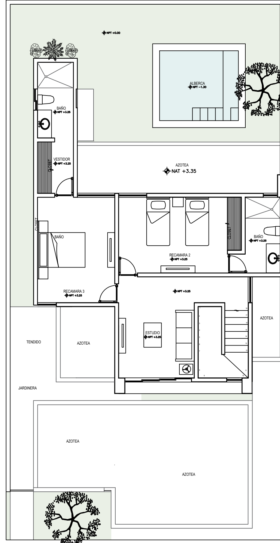
PLANTA ARQUITECTÓNICA ALTA ESC:1:100